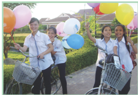
De retour de l'école

Cinq des quatorze grands en cycle universitaire en ce début d'année, ont été admis à l'Université de Quang Binh et de Dong Hoi. Un enfant suit son cycle universitaire à Danang en éducation physique, six autres sont à Hué en Sciences et Technologie et enfin les 2 derniers sont à Hanoi en Hôtellerie-Restauration.