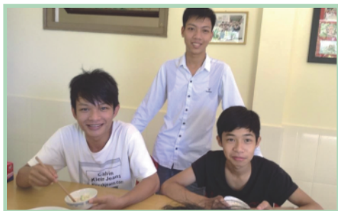
Heureux dans notre maison