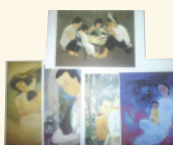
réf C Famille et Vie quotidienne