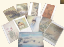
réf B Divers