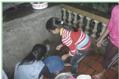
On fait la vaisselle