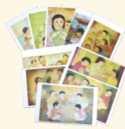
réf A Les enfants