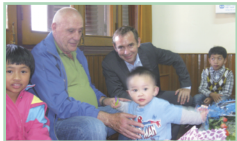
M. l'Ambassadeur (à droite) et le dernier-né du village

ciation humanitaire créée à Paris en 1970. Ils ont ensuite été accueillis par les mères et ils ont visité plusieurs maisons. Les enfants étaient ravis de cette visite et surtout admiratifs de la grande maîtrise de la langue vietnamienne de Mr l'Ambassadeur. Ce qui leur a permis d'échanger librement avec lui.