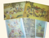
réf D Fêtes vietnamiennes