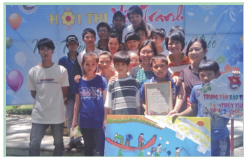
Avec des talents artistiques reconnus