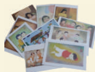
Les enfants «l'enfant couché» 10 cartes assorties