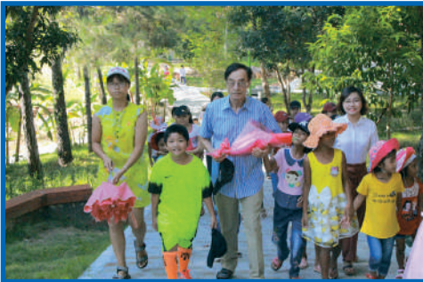
« Oncle Odon » bien entouré au Village de Hué

Tant d'émotion vécue par chacun ce soir-là !