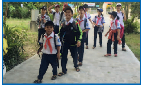
Les enfants sur la route principale du Village, au retour de l'école

mais qui sont si proches des enfants, leur font découvrir que l'amour ne connaît pas de frontières.