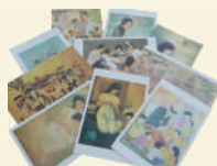
Famille et Vie quotidienne 10 cartes assorties