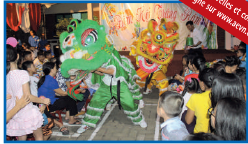
Danse de la licorne

footballeurs et tout le monde a participé avec beaucoup de plaisir.