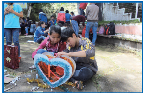
Concours de lanterne bientôt !

Après un beau spectacle de magie et de danse de la licorne exécutés par les grands enfants, arriva l'heure de la remise de prix tant attendu.