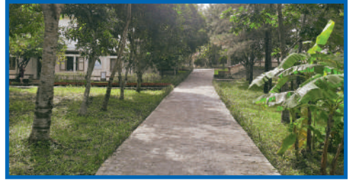
La nouvelle route du Village de Hué

Les murs extérieurs et intérieurs des trois maisons ont été repeints. Réfection des portes de la salle de séjour, des salles d'eau et renouvellement du mobilier s'avèrent nécessaires.