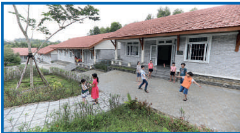
Les quatre nouvelles maisons du Village de Hué

Ces maisons « flambant neuf » ont été très appréciées par les enfants et les Mères.