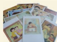
Les enfants «l'enfant endormi» 10 cartes assorties