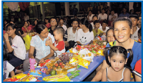
Dégustation en famille, fête de la mi-automne

Après cette belle procession lumineuse autour du Village, les enfants apprécient de déguster des fruits délicieux et d'écouter de la musique.