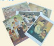
Famille et Vie quotidienne 5 cartes assorties