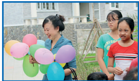
Mme Dao Hong Lan et les enfants du Village SOS de Hué

Le 27 septembre, lors de son voyage à Hué pour le Forum sur les femmes et sur l'économie de l'APEC 2017, la vice-Prési-