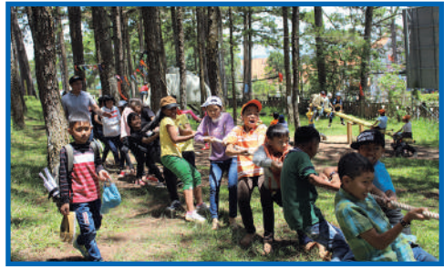
Oh hisse ! Tir à la corde au parc du Musée de Lam Dong

Ils ont regardé un film sur la faune et la flore de la réserve nationale de la Province et ils ont été initiés aux techniques artisanales de la peinture de Dong Ho.