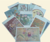
Les Fleurs 10 cartes assorties