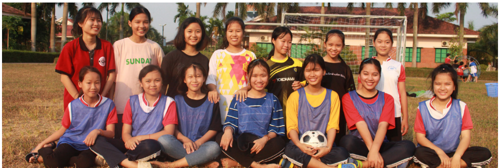
Allez les filles ! les footballeuses du Village SOS de Dong Hoi