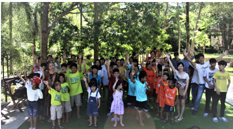
Une journée à Thac Mo

Durant l'année 2018-2019, les résultats scolaires des enfants sont encourageants : 23% ont la mention bien, 56% la mention assez bien et 21% la mention passable et aucune mention faible. L'une de nos jeunes a réussi le concours d'admission à l'université de Danang pour un cursus de 5 ans en commerce international. Trois jeunes qui sont aussi diplômés cette année en économie, en agriculture et sylviculture et en tourisme, commencent leur vie professionnelle depuis septembre.