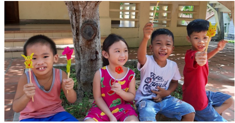
Fiers de leurs propres créations