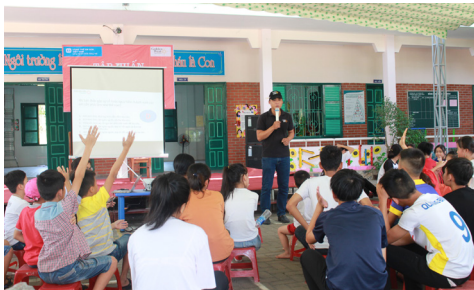
Initiation aux gestes de premiers secours

P endant les vacances scolaires, plusieurs activités ont été organisées : les ateliers de dessin étaient les plus demandés par les petits, qui prenaient beaucoup de plaisir à s'aventurer dans le monde des couleurs, et parfois surprenaient les