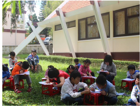
Atelier de dessin en plein air