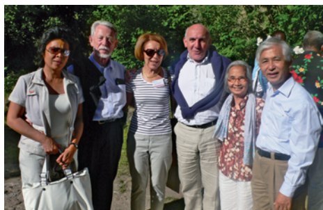
Délégations SOS Villages d'Enfants France et AEVN

La 18ème Assemblée générale de la Fédération Internationale des Villages d'Enfants SOS (FISOS) a eu lieu (se réunissant tous les quatre ans) à Innsbruck en juillet 2008. Cent six membres sur cent quinze étaient présents.