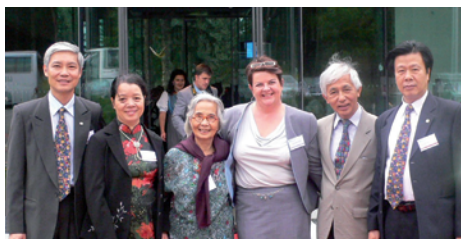
Délégations SOS Vietnam, FISOS et AEVN

La FISOS a mis sur pied, lors de la précédente assemblée, un programme de «renforcement des familles» visant à étendre l'aide aux enfants en détresse par leur maintien dans leur famille ceci en liaison étroite avec les directeurs des