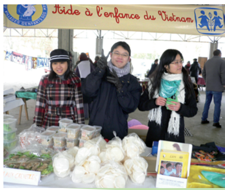
Marché de Noël Gif sur Yvette