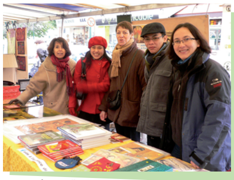
Marché de Noël Vincennes